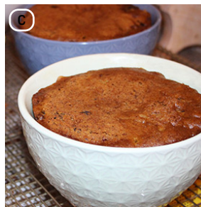
C- La pudding cuite dans des petits bols en céramique